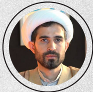
حجت الاسلام احمد رضا اعلائی