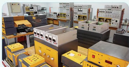
دکتر سجاد گلشن نواز گروه مهندسی برق - قدرت