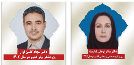
دکتر سجاد گلشن نواز یژوهشگر برتر کشور در سال ۱۴۰۲

دو نفر از اساتید دانشکده مهندسی برق، کامپیوتر و فناوری های پیشرفته در بین اساتید برتر ایران قرار دارند: